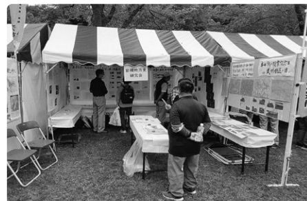
「岩槻やまぶさまつり」での活動紹介の様子