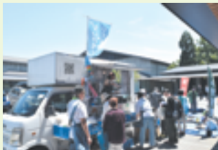
子ども食堂コーナー