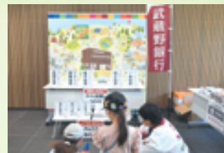
SDGs・金融経済ゲームコーナー