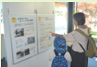
めざせ人形ハカセコーナー

5月5日に岩槻人形博物館、武蔵野銀行、さいたま市子ども食堂ネットワークの共催でこどもの日イベントが開催されました。イベントでは、「めざせ人形ハカセ」と題し、ワークシートを通じて岩槻の人形を学ぶ取組が行われたほか、SDGs・金融経済について学ぶゲームや子ども食堂、木工体験などが行われ、多くの来場者で賑わいました。来場者からは、「ゲーム・体験形式で、楽しく学べた」などの声が聞かれました。