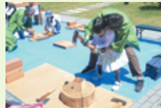
木工体験コーナー