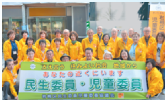
岩槻区民生委員・児童委員の皆さんとともに