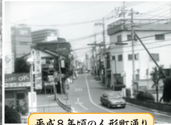
平成8年頃の人形町通り