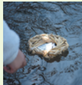
▲さん儀を菖蒲池に流す様子