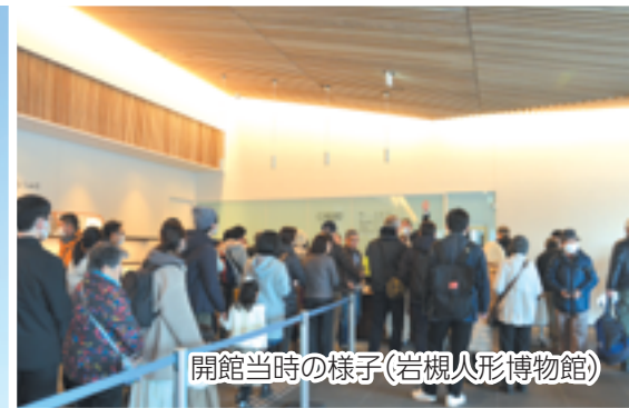
開館当時の様子(岩槻人形博物館)