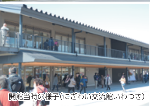
開館当時の様子(にぎわい交流館いわつき)