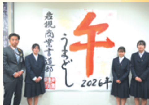
岩槻商業高校書道部の皆さんが制作した 干支(午)の書道の作品とともに