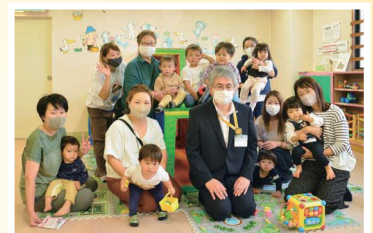
児童センター利用者の皆さんと

児室、工作室等の施設が充実しており、初めての子どもたちでも楽しく過ごせるようになってきました。また、イベントも数多く開催していますので、児童センターに問い合わせただくか、ホームページで確認してみてください。