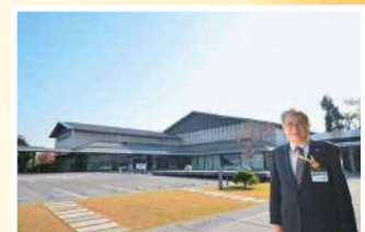
岩槻人形博物館にて

岩槻人形博物館は、城下町岩槻の歴史風土を反映した外観デザインとなっています。人形づくりや人形文化の保存・継承拠点、まちの魅力と賑わいを発信する拠点として、将来にわたり貴重な景観資源となるよう区民の皆様とともに大切に守っていききたいと思います。