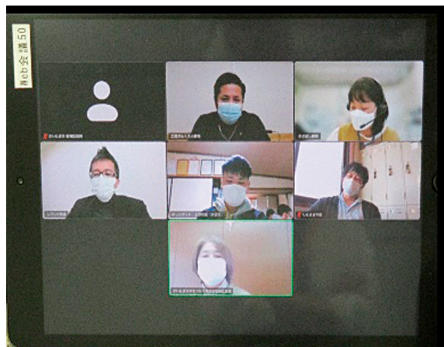
顔のみえるネットワーク会議

障害のある方の支援に携わる関係機関の連携を強化し、支援の専門性を高めるため「顔の見えるネットワーク会議」を開催します。