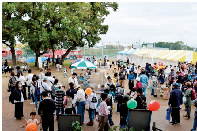
岩槻やまぶきまつり

区民と区の協働で、より多くの人たちがふれあうことのできる、多世代交流イベントを開催します。