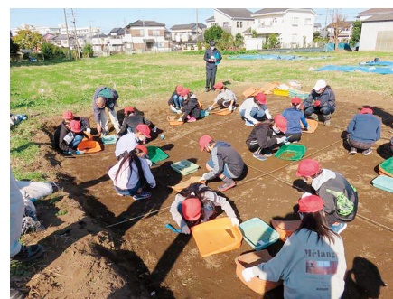
小学生の体験発掘