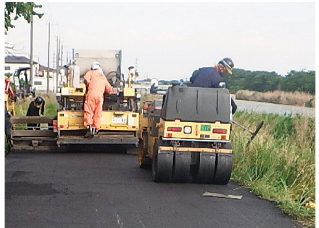
道路等の緊急修繕

道路反射鏡、道路照明灯等の修繕・新設を行うとともに、道路等の危険箇所を把握し、修繕を迅速に実施します。