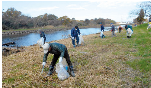
元荒川クリーン活動

交通安全キャンペーン（4回）、自転車安全利用啓発（4回）、高齢者や子どもの交通安全啓発（18回）及びドライバー大会を実施します。