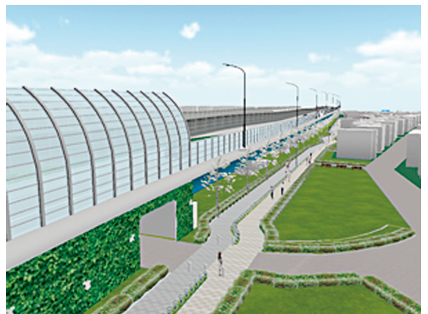
国道122号蓮田岩槻バイパス完成イメージ