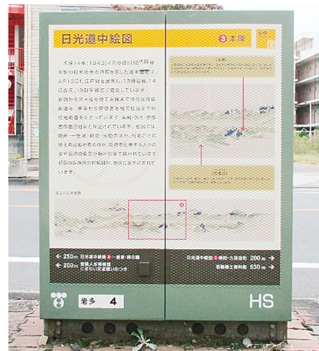
トランスボックスのラッピング

生活習慣病や介護予防などに効果的なウォーキング方法などを学ぶ講習会や岩槻のまちを巡るウォーキングイベントを開催します。