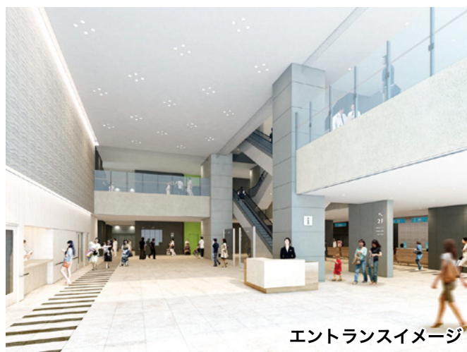
エントランスイメージ

※広報誌えがおは当院ホームページ（ http://saitama-city-hsp.jp ）に掲載しておりますので、どうぞご覧ください。 ※この印刷物は700部制作し、1部当たりの印刷経費は81円です。