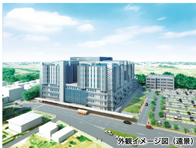
外観イメージ図（遠景）