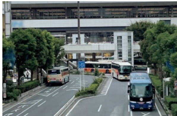
バスターミナルを中心としたまちづくり 備えるべき機能は交通・交流・サービス・防災

A (仮称)バスタ大宮の候補地が、現段階で選定まで至っていないことから、アクセス道路についても今後の検討課題となっている。本市としては、高速道路ネットワークとのアクセス向上が重要な要素の一つと考えていることから、今後候補地が選定された際には、首都高速道路の地下直接接続に