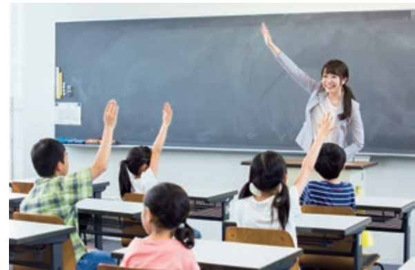
教職員の働き方改革 まずは安心して働ける環境の確保が重要

プールへの水の出っぱなしによる教職員への損害賠償事案が他自治体である。教職員の働き方にもかかわる問題と考えるが、本市の損害