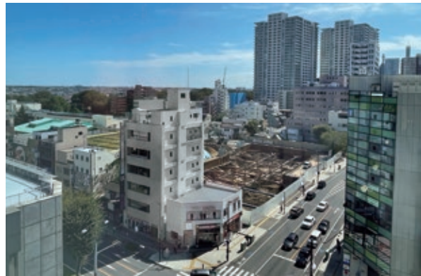
旧大宮区役所跡地と大宮小学校 今後の方向性について早期の結論が望まれる

旧大宮区役所跡地の活用と大宮小学校の方向性の結論を早く出すべき。現在の検討状況は。大宮小を複合化する場合、夜間中学、学びの多