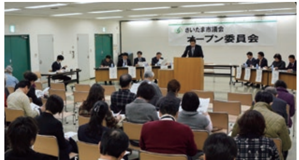
過去に開催されたオープン委員会の様子