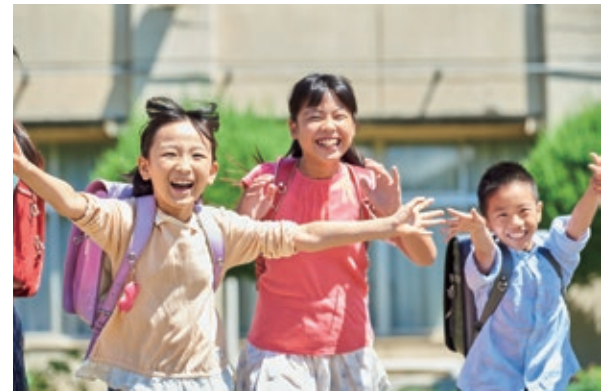
予測困難な時代を生きる子どもたちのため 教育の質の向上と良好な環境の整備が急務

A 「日本一の教育都市」で 育った子どもは、「日 本一幸せな子ども」になってほ しいと願い、その実現を目指し て、様々な教育施策を引き続き 展開していく。これからの「日本 一の教育都市」の実現には、学校