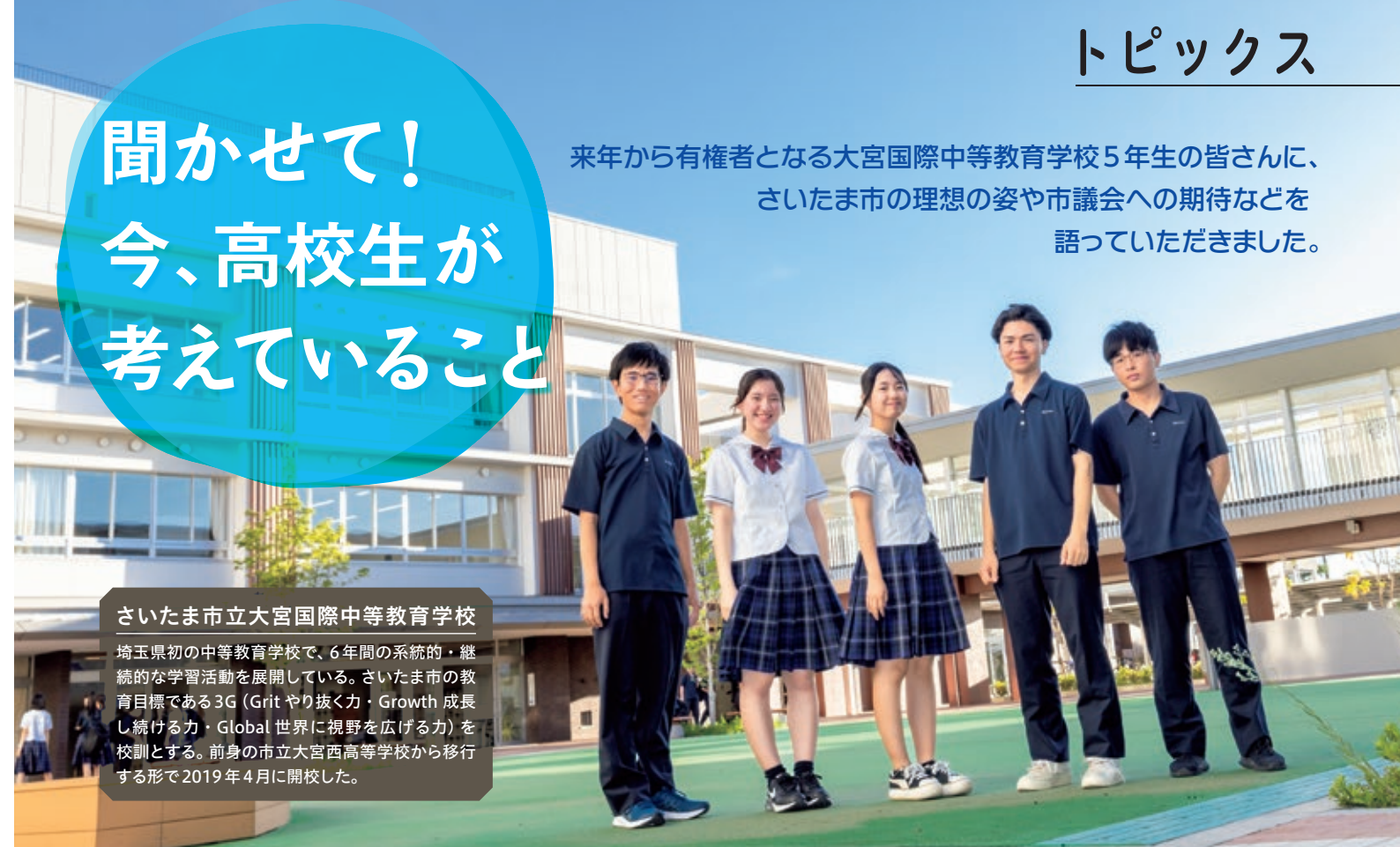
来年から有権者となる大宮国際中等教育学校5年生の皆さんに、さいたま市の理想の姿や市議会への期待などを語っていただきました。