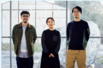
現代アートチーム 目[mé]