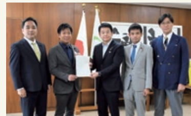
提言書を提出しました

令和4年度の一般会計決算額は、歳入6,649億円、歳出6,559億円となり、過去2番目の決算規模となりました。決算特別委員会での審査の後、本会議での採決の結果、一般会計・特別会計決算については「不認定」、企業会計決算については「認定」又は「認定及び原案可決」されました。また、決算特別委員会では審査の過程で指摘した改善点や要望などを令和6年度の予算編成に向けた提言書として14項目にまとめ、市長に提出しました。