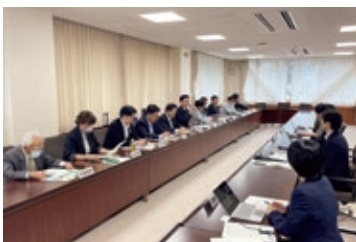
福井県ではICTを活用した障がい者への情報支援や情報保障を調査(11月)

手話言語条例を前進させるため、福井県と長野市の先進事例を調査しました。また、オープン委員会を開催し、学識経験者から日本における手話言語コミュニケーションの現状や音声認識アプリの社会への広がりについてお話を伺い、情報保障の課題と可能性を共有し、聴覚障がい者・難聴者が取り残されない社会を市民とともに考えました。