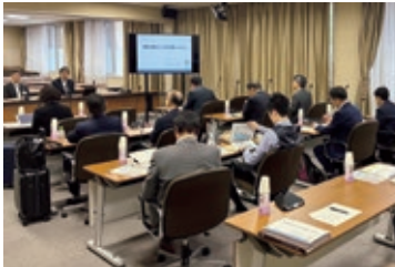
和歌山県では「和歌山県子ども計画」などについて調査(10月)

近年、いじめや虐待など、未来ある子どもが犠牲になる事案が急増していることから、「未来を担う子どもの権利について」をテーマに、和歌山県と大阪府の先進事例を視察しました。すべての子どもが、かけがえのない存在として尊重されなければならないことを十分認識し、今後も子どもの権利保障に向け、全力で支援していきます。