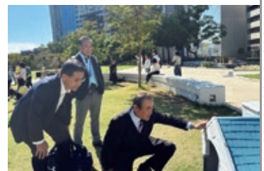
神戸市では自動芝刈機のドックが設置されている「東遊園地」を視察(10月)

本委員会では、公園や道路などの様々な都市機能を活用しながら、魅力あふれ、人が集う「にぎわいのあるまちづくり」をテーマに研究を行いました。神戸市と大津市への視察を行い、駅前広場や公園などの公共空間を活用し、居心地が良く、自然と人が集まるまちなかを、地域の方々とともに創出する取組について研究しました。