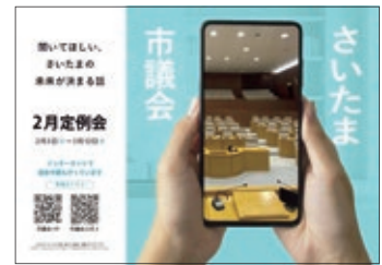
定例会周知ポスター