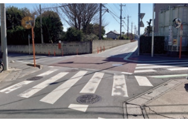
島町西部土地区画整理事業地の境の交差点危険解消へ工事中路線の早期開通が望まれる

A 工事中の路線は、ハレノテラス交差点の改修などの整備が残っており、早期開通に向け、当該路線と地区外の細街路との交差点の在り方の安全対策を含めた検討を行い、これを踏まえ街灯設置などの整備を行う予定である。また、安全確保の仕組みについて、土地区画整理組合による道路の整備状況が教育委員会にも情報共有される仕組みを早急に検討するとともに、通学路合同点検に係る連携も強化していく。