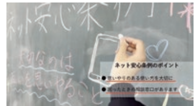
ネット安心条例PR動画