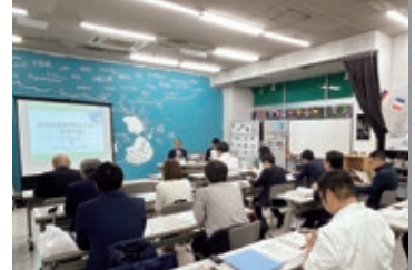
長岡市の国際交流センター「地球広場」の取組を調査(10月)

本委員会では、長岡市と新潟市を視察し、国際交流センターの運営方法や先進事例などを学びました。現在、本市の国際交流センターは多くのボランティアの協力により運営されています。約3万人の外国にルーツのある方が永住者として本市を選んでいただいていることを踏まえ、本市における多文化共生に向けた取組の充実を期待します。