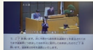
インターネット議会中継画面

聴覚に障がいのある方などに対する情報取得の機会拡大および利便性の向上を目的として、2月定例会の本会議(3月11日・12日)において、議場内に手話通訳者を配置し、発言者と同時にインターネット議会中継画面に映写するとともに、中継画面にAIによるリアルタイム字幕を表示する取組を試行的に実施しました。