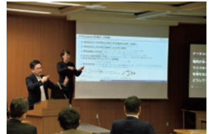
会場ではAI文字反訳も活用