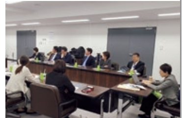
仙台市では市民に脱炭素行動を促すアプリ活用や対面型イベントなどを調査(11月)

本市の温室効果ガス排出量は、家庭部門と業務部門で全体の約65%を占め、市民や事業者の脱炭素への取組が欠かれないことから、市民参加の先進事例である仙台市の「せんだいゼロカーボン市民会議」の調査を行いました。本市においても、買い物や移動手段など、日々の選択によるCO 2 排出削減が進むよう支援していきます。