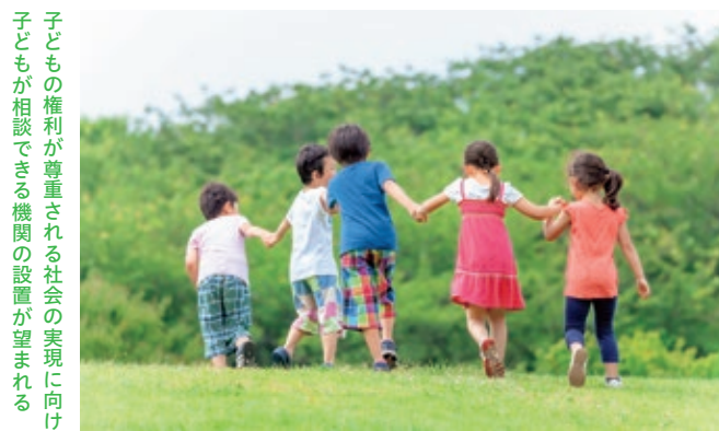
子どもの権利が尊重される社会の実現に向け 子どもが相談できる機関の設置が望まれる

A 実効性のある機関の設 置は、子どもを権利侵 害から救済する重要なポイント と考える。まずは学校や教育委 員会から独立した常設の第三者