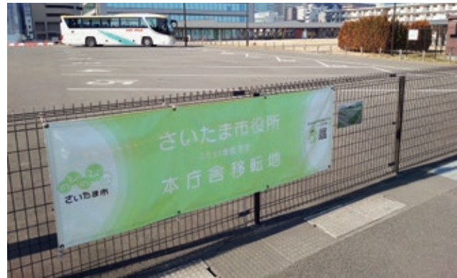
市役所本庁舎の移転地 市民に愛される庁舎となることが期待される

A 新庁舎整備に当たり、市民のための市庁舎であることを大前提に、丁寧に議論を重ねてきた。その結果、防災中枢拠点としての機能、質の高い行政サービスを持続的に提供するための執務環境、市民が憩い、交流を生む市民広場など、