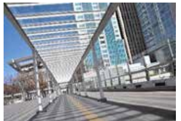
さいたま新都心駅周辺 歩行者デッキ