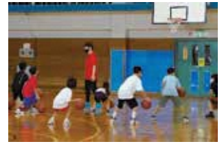
バスケットボール教室の様子

1 バスケットボール教室の開催 (区事業) 目標・予定 ・アンケート満足度90%以上 ・定員80人 子どもたちの健全育成とスポーツを通して参加者間の交流促進を図るため、地元プロバスケットボールチーム「さいたまブロンコス」の協力を得て、バスケットボール教室を開催します。