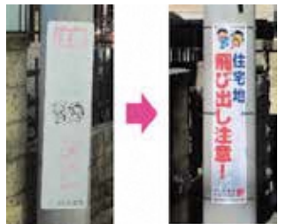
交通安全看板の更新

1 交通安全啓発と身近な生活環境の保持 (区事業) 目標・予定 ・道路パトロール年120日以上 ・修繕要望後3日以内の対応 ・看板年60箇所更新 交通事故防止や危険箇所発見のため、道路パトロールを実施します。また、道路照明灯、道路反射鏡等の修繕の迅速な対応や劣化した交通安全看板を計画的に更新します。