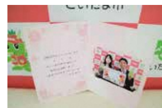
婚姻届提出記念写真