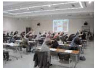
高齢者向け講座の様子

3 地域防災力の向上 (区事業) 目標・予定 ・講座、講演会等4回実施 ・アンケート満足度90%以上 区内の避難所において避難所運営訓練を実施します。また、区役所内での防災展の実施や、自主防災組織を対象とした講演会や講座を開催します。