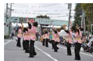
令和元年度区民まつりの様子