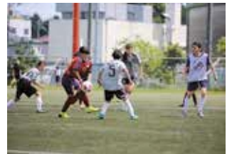
SAITAMA GIRLS MATCHの様子

3 サッカーのまちづくりの推進 (スポーツ文化局事業) 目標・予定 ・参加者数100人(実人数) (小学生女子サッカークリニック) ・参加チーム数21チーム (SAITAMA GIRLS MATCH) 八王子グラウンド等において小学生女子を対象とした練習会や中学生女子サッカーチームによるSAITAMA GIRLS MATCHを開催します。