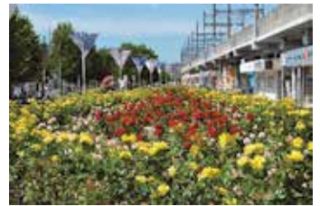
アートストリートエリア (与野本町駅周辺)