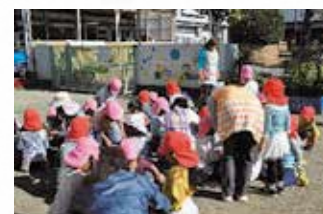
下落合団地保育園