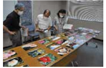
バラの写真コンクール 審査の様子