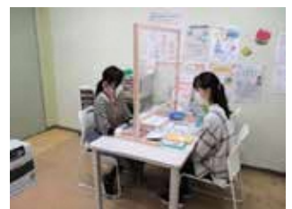
母子保健相談員による面接の様子

5 高齢者向け講座の開催 (区事業) 目標・予定 ・アンケート満足度90%以上 ・定員50人 高齢者がいつまでも元気で自分らしく暮らしていくことができるよう、体組成計による測定会、栄養(口腔)等についての講演会や簡単にできる運動の体験会を実施する講座を開催します。