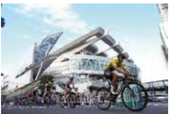
国際自転車競技大会の様子