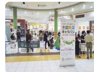
※写真は令和元年度の様子です。