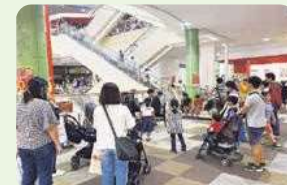
※写真は令和元年度の様子です。

会員(加入団体)の皆さんの活動を紹介し、ネットワークをつくっていただくための「団体ガイド」をご用意しています。事務局へどうぞ。