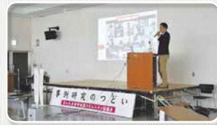
※写真は昨年度の様子です。

今年度は、新型コロナウイルス感染症拡大防止のため、事前申込み制とさせていただきます。参加希望の方は、事前に問合せ先までご連絡ください。当日は、手指消毒、検温、マスク着用のご協力をお願いいたします。