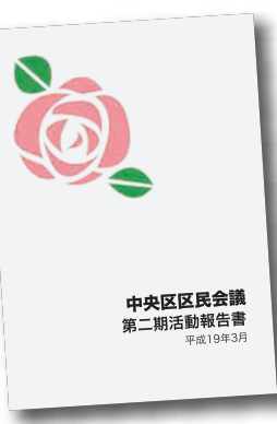
▲第2期区民会議活動報告書

● (他区の「コミュニティ会議」と違い)連合組織のため、大きな市民活動・事業が可能である反面、個々の団体等が活動をするための支援が困難 ↓事業計画等の明示を前提に、オープンな審査体制で、個々の活動が支援を受けられる仕組みを整える必要