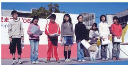
▲区民まつり'06表彰式

地域の皆様 の歯とお口の 健康を守り、 よきパートナー となるべく よう心から 願っています。