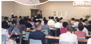
▲生涯学習セミナー