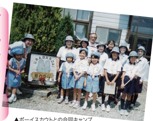
▲ボーイスカウトとの合同キャンプ

当団は、昭和45年5月5日に発団。埼玉県で14番目の団として登録以来、下落合公民館を拠点に月2〜3回集会を続けております。「やくそくとおきて」を基本とし、活動のポイントは「自己開発」「人とのまじわり」「自然とともに」を主としています。少女会員は年代に応じた5つの部門に分かれ、成人会員は「リーダー」「運営員」で役割を担当、スカウトたちを支援しています。少女たちが責任ある市民として自ら考え、行動できる女性に成長することを目指し、キャンプや地域での諸行事、老人ホームの奉仕、募金活動に協力しています。