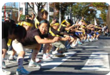
◀よさこいソーラン

のふれあいを大切にした「コミュニティまつり」として、これからも「コミ協(区民の皆さん)」が中心の区民まつりにしていきたいですね。