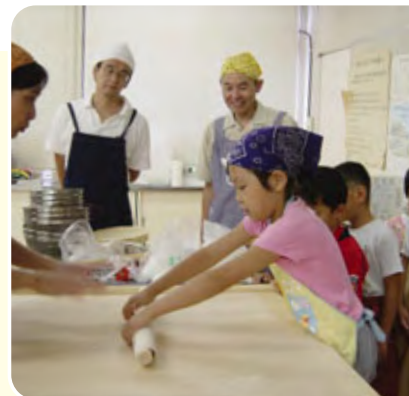
▲親子でうどん作り

※与野西北小学校は昨年創立40周年を迎え、「親子ふれあい広場」も記念行事として近隣の中学生やボイスアウトの皆さんなどの協力もあり、盛大に行われたそうですよ。