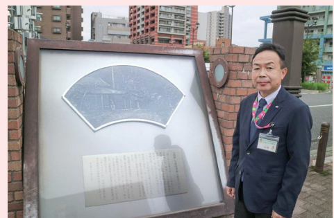
▲与野駅西口広場にて