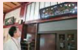
▲長伝寺本堂入口にある「水飲み竜」の彫り物を見学

※現在は、本堂入口にあります。見学の際は、マナーを守っていただきますようお願いいたします。