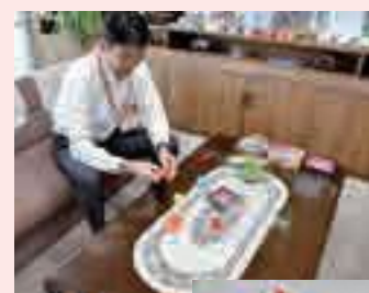
▲区の花バラを折り紙で

区では、地球温暖化対策の一環として、軽装(ノーネクタイ・ノー上着)での執務をさせていただいておりますので、ご理解をよろしくお願いいたします。