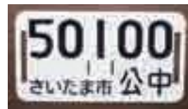
▲管理番号プレート

問合せ 新設について 区くらし応援室 ☎840・6026 ☎840・6162 コールセンターについて 市民生活安全課 ☎829・1219 ☎829・1969