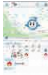
▲さいちゃんアプリホーム画面

問合せ ごみ分別について 区くらし応援室 ☎840・6026 ☎840・6162 さいちゃんアプリについて 資源循環政策課 ☎829・1338 ☎829・1991