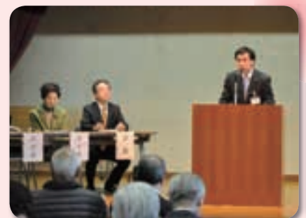
4月10日(金) 中央区コミュニティ協議会総会

また暑い夏がやってきます。今年も区役所では夏の間、冷房は弱めに設定し、ノーネクタイ・ノー上着の軽装で執務を行います。区民の皆さんも、暮らしの中でできる節電への取り組みに、ご協力をお願いいたします。