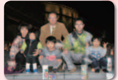
12月21日(出) キャンドルアートナイトにて

また、この時期は、就職や転職に伴う引越しシーズンともなり、区役所の窓口は大変な混雑となります。このため、今月は、最終土曜日と日曜日にも区役所窓口を開設いたします。開設時間や取扱い業務など、詳しくは区報の今月号巻頭もご覧ください。