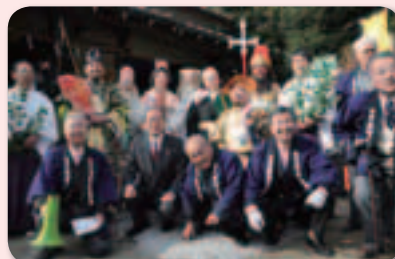
1月3日(金) 七福神仮装パレードにて