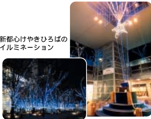
新都心けやきひろばのイルミネーション

11月22日(土) ~ 平成16年2月15日(日) 点灯時間 17:00~23:00