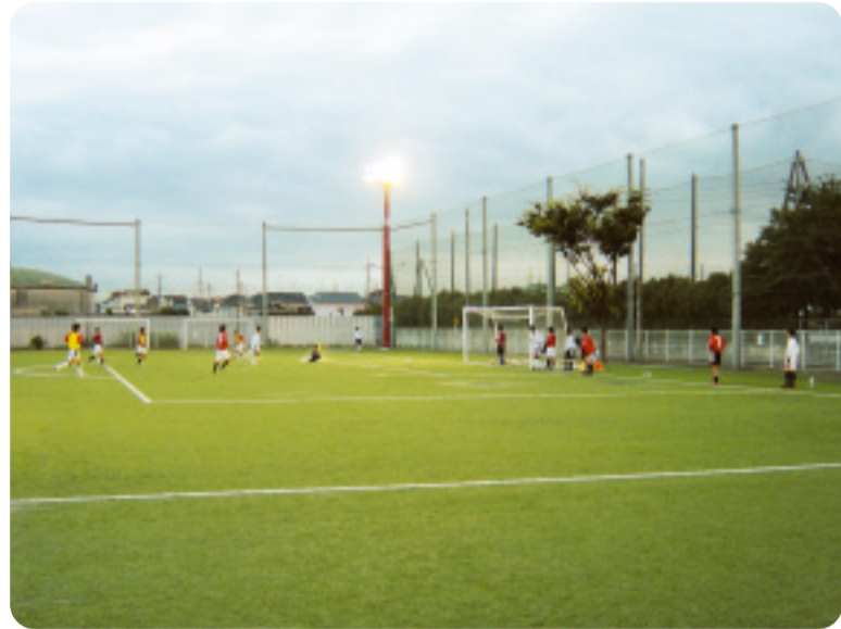
▲浦和レッズユースも練習しています。

八王子スポーツ施設(サッカー場) 八王子4丁目 すばらしい人工芝に様替わりし、ナイター照明もつきました。