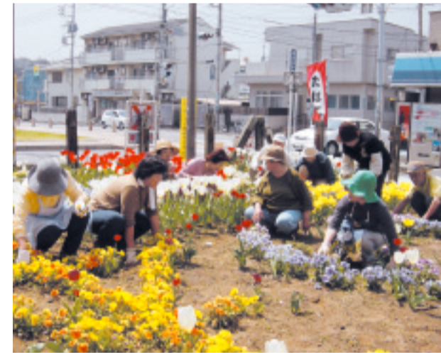
街角に花を植えるコミュニティ活動グループ

今、街のあちらこちで様々な分野においてグループ活動がなされており、その中で新たな人間関係がつつかわれ、コミュニティ意識が高まっております。 「街を良くしよう」「人とのかわわりを大切にしたい」「近所づき合いを大切にしたい」「自分自身が何か役に立てれば」等々のお考えを持って活動されている皆さんには、是非とも