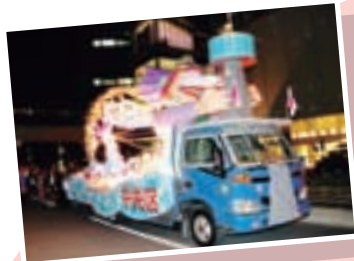
▲中央区ドラゴンフロート