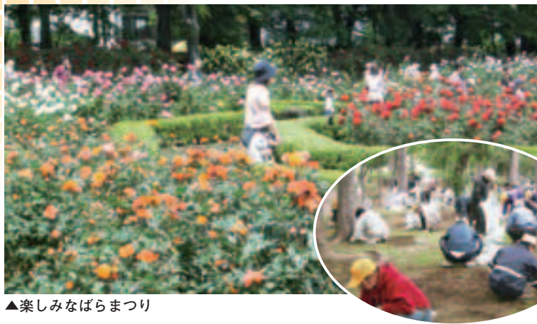
▲楽しみばらまつり