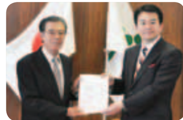
星野会長から清水市長に▲