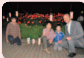
5月17日(金) キャンドルアートナイトにて

さて、今年も7月中旬、中央区内各地域で「与野夏祭り」が開催されます。なかでも本町通り周辺では、13日(土)と14日(日)、沿道に夜店が立ち並ぶなか、6基のおみこしが渡御するもので、見ごたえ十分です。ぜひお出かけいただき、夏祭りのだいご味をお楽しみください。