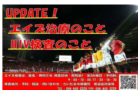
浦和レッズポスター