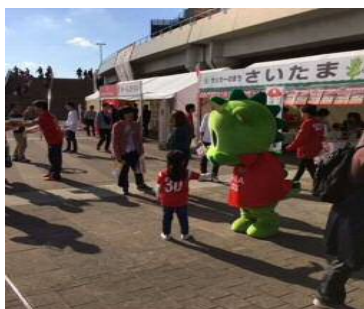
サッカースタジアム啓発活動

平成 31 年 1 月 14 日に成人式会場である、さいたまスーパーアリーナで、普及啓発グッズの配布を実施した。