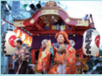
中山道みやはらまつり