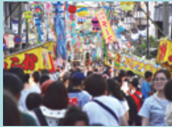
大宮日進七夕まつり

日時：8月1日(土)・2日(日) 17時～21時(2日は22時まで) 会場：大宮駅東口周辺