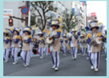
スパークカーニバル