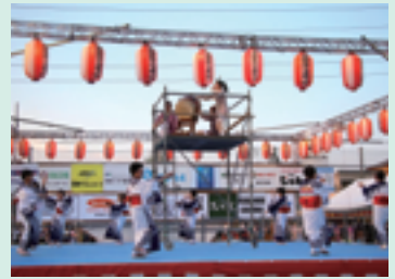
東大宮サマーフェスティバル

日時：8月6日(木)・7日(金) 15時～21時 会場：日進七夕通り周辺(日進駅南口)