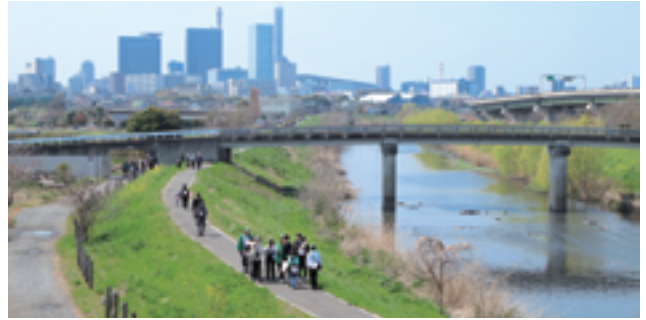
▲見沼田んぼの自然を楽しみながら、幅広い世代の参加者がウォーキングに参加しました