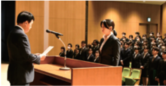
▲入庁する職員表情には、本市の将来を担う覚悟と希望が しっかりと感じられました