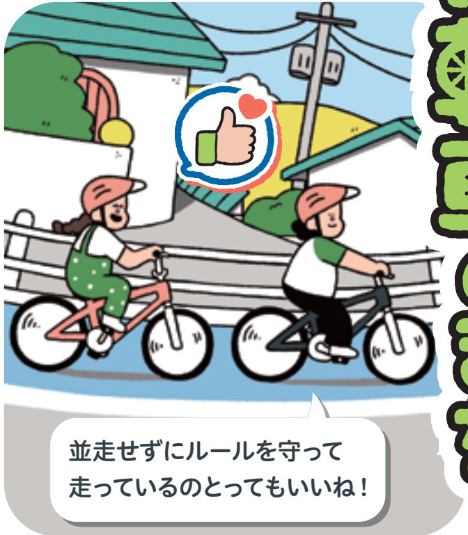
並走せずにルールを守って 走っているのとってもいいね!