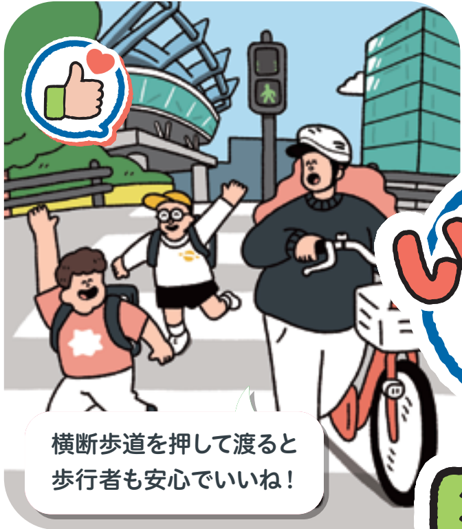
横断歩道を押して渡ると 歩行者も安心でいいね!