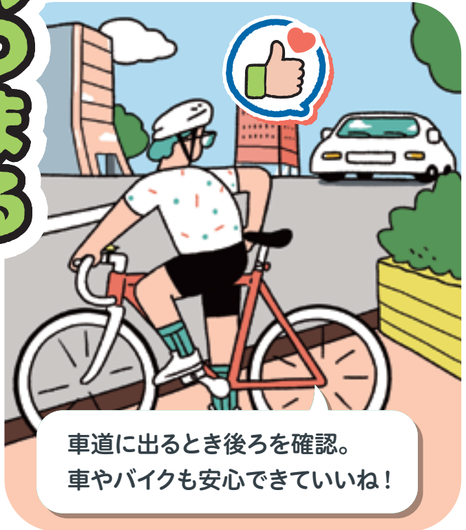
車道に出るとき後ろを確認。 車やバイクも安心できていいね!