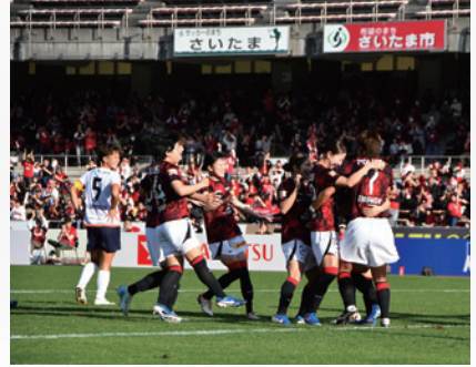
▲本市をホームタウンとする三菱重工浦和レズレディースと大宮アルディージャVENTUSの白熱した戦いが繰り広げられました