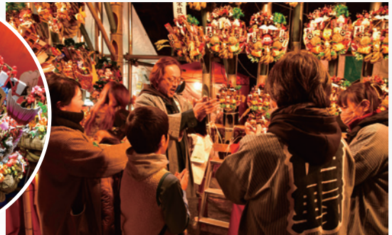
▲福を求める多くの方が訪れ、威勢のいい掛け声と手締めの音が響きました