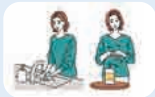
手洗い・手指消毒