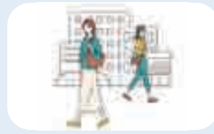
人と人との距離の確保