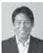
にしの りょう 西野 朗 元サッカー選手 指導者

また、さいたま国際芸術祭実行委員会委員、市文化芸術都市創造審議会委員を務めるなど、本市の文化芸術の振興・発展に大きく寄与された。