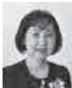
くりに きょうこ 栗木 京子 歌人

歌集「けむり水晶」で逍空賞に輝き、平成26年に紫綬褒章を受章。また、現代歌人協会の理事長を務めるなど、現代短歌界の発展に多大な貢献を果たされている。