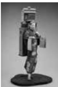
▲「紅絵売り」 岡本玉水 昭和時代

3月21日(祝)まで 9時〜17時 近代のおもちや絵や人形作家の雛人形などの展示