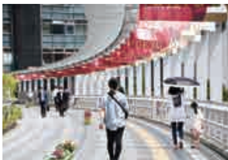
▲北与野デッキ周辺(北与野駅南口)