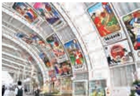
▲さいたま新都心駅東西自由通路