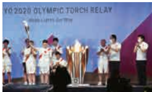
▲聖火がトーチから聖火皿に灯されました