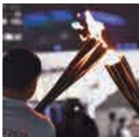
◀▲聖火ランナーたちがトーチ キスで聖火を繋ぎました