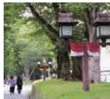
▲氷川参道(大宮区高鼻町)