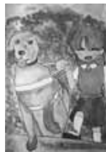
▲昨年度の最優秀作品 「盲導犬とどこまでも行こう!」

■心の輪を広げる体験作文 テーマ 障害のある方とない方との心のふれあいの体験 対象 市内在住で、小学生以上の方