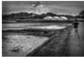
▲昨年度の金賞作品 「夕暮れたんぼ」

題材 見沼たんぼの風景・生きもの・文化財・伝統行事など 応募用紙 市役所見沼田圃政策推進室、各区情報公開コーナー、各支所・市民の窓口などで配布中 ※見沼たんぼのホームページ(☎http://www.ninunatanbo-satama.jp/)でもできます。