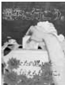
▲昨年度の入選作品