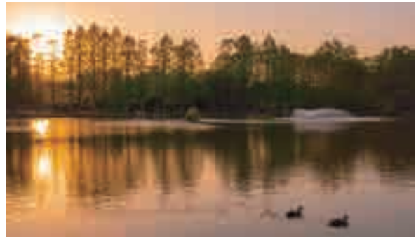
▲別所沼公園(南区別所)