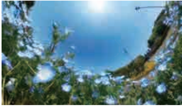
▲大宮花の丘農林公園(西区西新井)