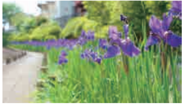
▲千貫樋水郷公園(桜区五関)