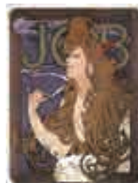
▲(ジョブ)1896年