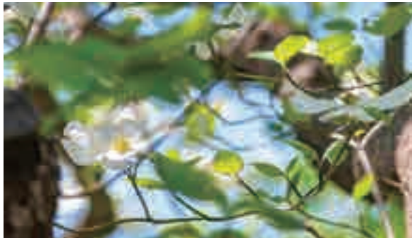
▲はなみずき通り(大宮区堀の内町ほか)