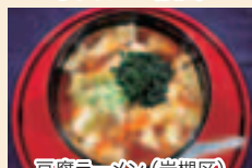
豆腐ラーメン (岩槻区)