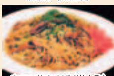
辛子焼そば (嵐山町)