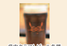
県内クラフトビール各種