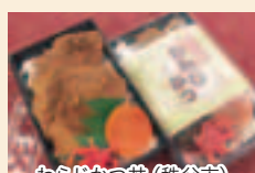
わらじかつ丼 (秩父市)