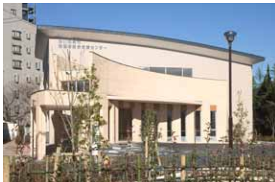
障害者総合支援センター