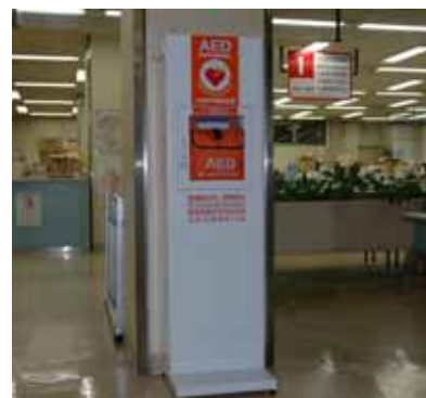
AED(自動体外式除細動器)