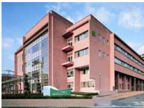
保健所・健康科学研究センター

「保健所」や「健康科学研究センター」、「障害者総合支援センター」など、指定都市にふさわしい核となる基盤施設を開設しました。