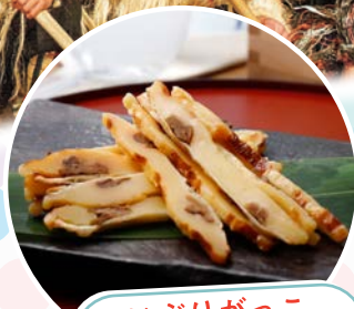
いぶりがっこ 焼きチーズサンド