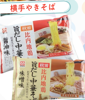
比内地鶏旨だし中華そば