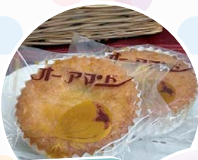
いちじく オーアモンド