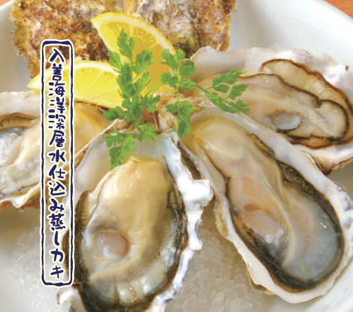
入善町産水産物 生牡蠣