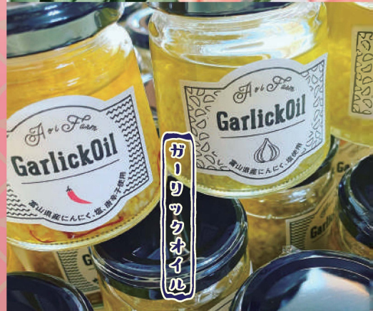
ガーリックオイル