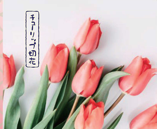
チューリップ切花