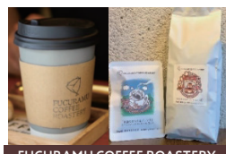
FUCURAMU COFFEE ROASTERY