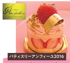
パティスリーアンフィユ2016 フレジェフレーズ

カスタードクリームをサンドし、生クリームで覆った今日だけのスペシャルショートケーキ