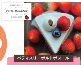
パティスリーポルトボヌール いちごショートスペシャル

カスタードクリームをサンドし、生クリームで覆った今日だけのスペシャルショートケーキ