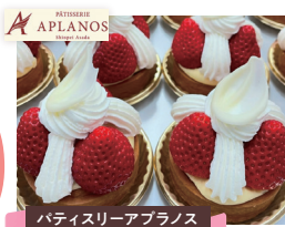
パティスリーアプラノス あまりんタルト