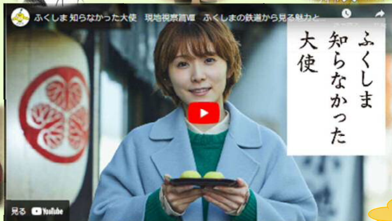
現地視察篇Ⅷ ふくしまの鉄道から見る魅力と伝統