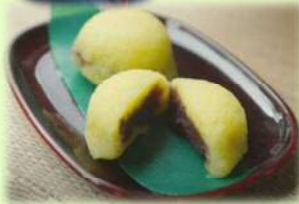
奥会津柳津 あわまんじゅう