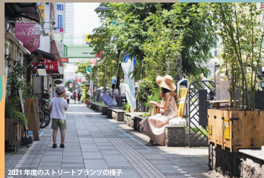
2021年度のストリートプランツの様子