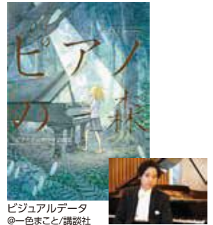
ビジュアルデータ @一色まこと/講談社