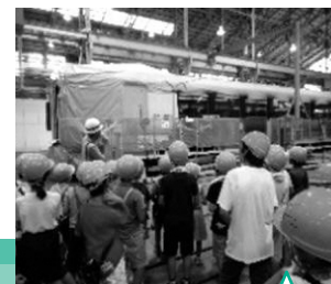
車両センター見学