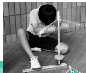
火おこし器づくり