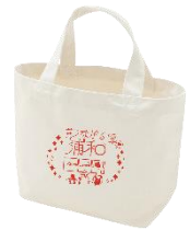
特製トートバッグ