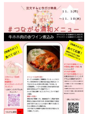
メニューボードイメージ