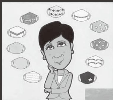
2020大賞(一般)受賞作 『小池都知事 マスクコレクション』