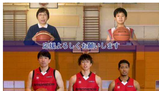
バスケットボール編